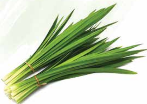
Frozen Pandan Leaves