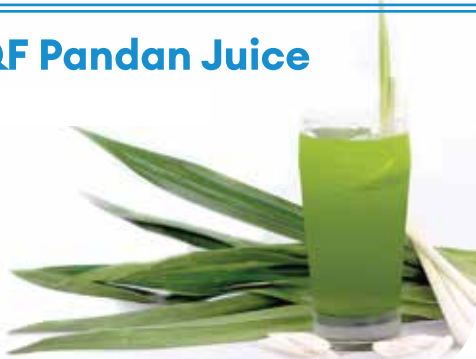
IQF Pandan Juice