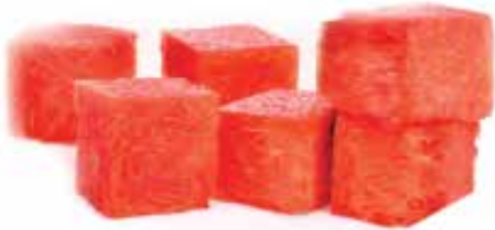
IQF Diced Seedless Watermelon