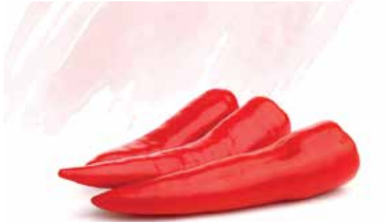
Frozen Red Chili Without Stem