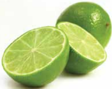
Frozen Sliced Seedless Lime