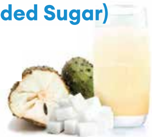
IQF Soursop Cup (With Added Sugar)