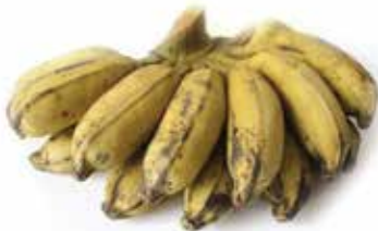
IQF Vietnamese Plaintain