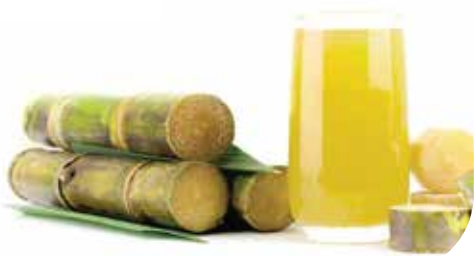
IQF Sugarcane Juice