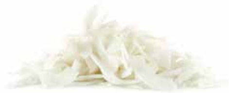
IQF Shredded Young Coconut