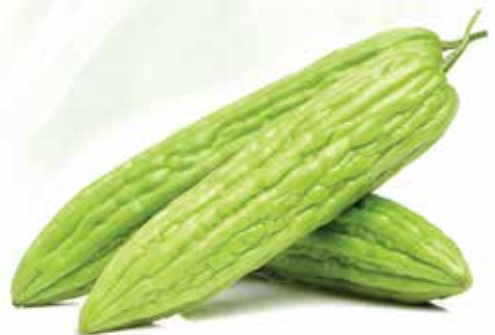
Frozen Whole Bitter Melon