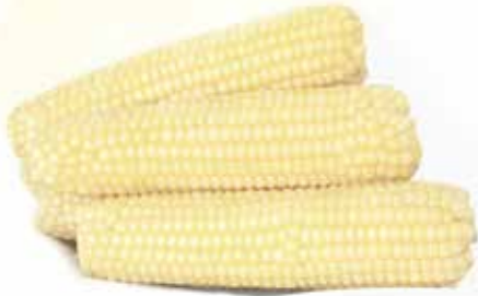
Frozen Boiled Waxy Corn