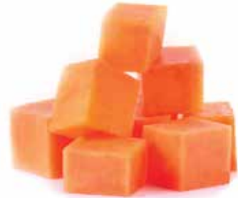
IQF Diced Papaya