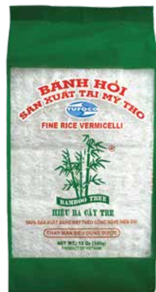
Fine Rice Vermicelli