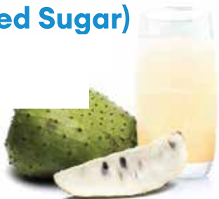
IQF Soursop Box (No Added Sugar)