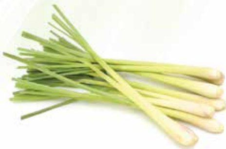
Frozen Whole Lemongrass