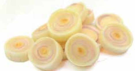
Frozen Sliced Lemongrass