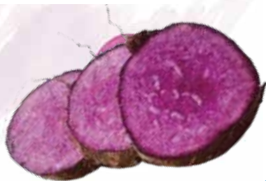
Frozen Sliced Purple Yam