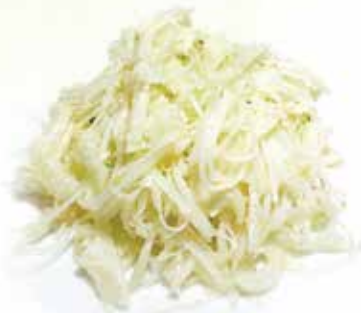
Frozen Shredded Green Papaya