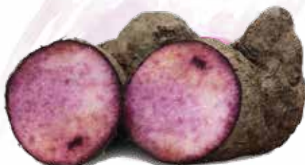
Frozen Whole Purple Yam