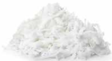
IQF Grated Young Coconut