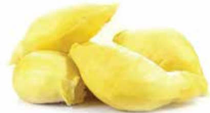
IQF Seedless Durian