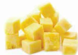
IQF Diced Seedless Passion fruit