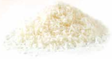
Frozen Grated Cassava