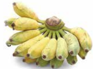
IQF Xiem Banana