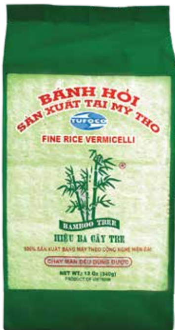
Fine Rice Vermicelli Natural Pandan Color