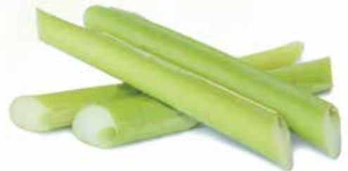
Frozen Sliced Galadium