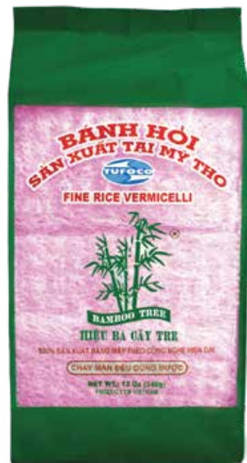
Fine Rice Vermicelli Natural Magenta Color