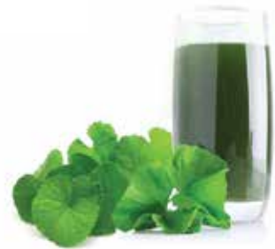
IQF Pennyworth Juice