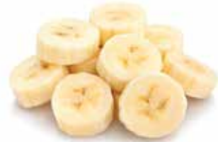
IQF Banana chunk