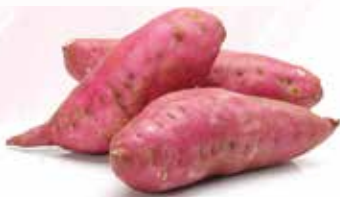
Frozen Steamed Sweet Potato