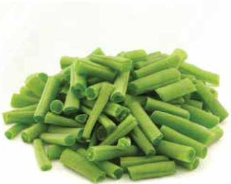
Frozen Cut Green Bean