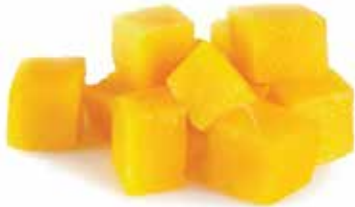
IQF Diced Kaew Mango