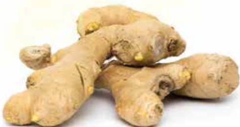
Frozen Ginger With Skin