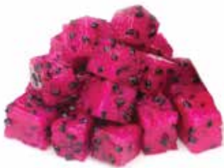
IQF Diced Red Dragon Fruit