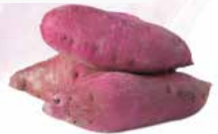
Frozen Steamed Sweet Purple Potato