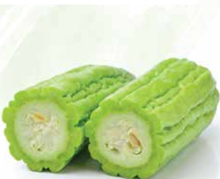
Frozen Bitter Melon Halves