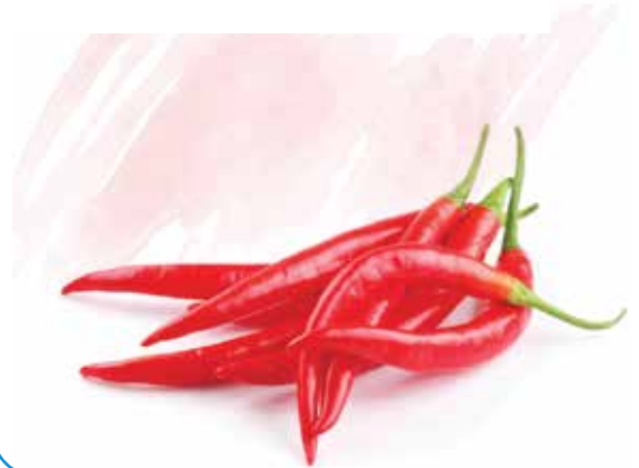
Frozen Red Chili With Stem