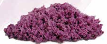
Frozen Grated Purple Yam