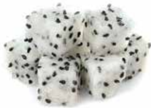
IQF Diced White Dragon Fruit