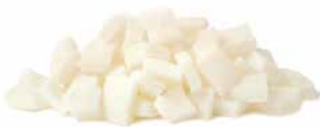
IQF Diced Coconut Meat