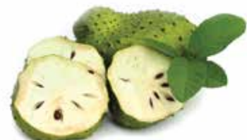
IQF Pulp Soursop