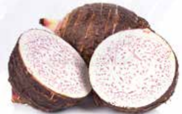
Frozen Taro Halves