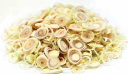
Frozen Minced/Chopped Lemongrass