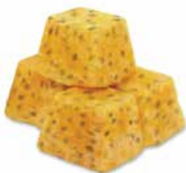
IQF Diced Passion fruit