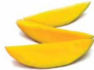
IQF Sliced Cat Chu Mango