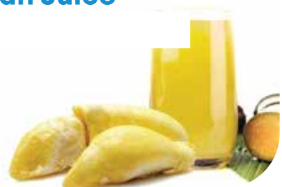
IQF Sugarcane - Durian Juice